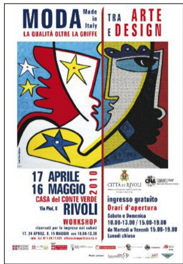
Il manifesto della mostra